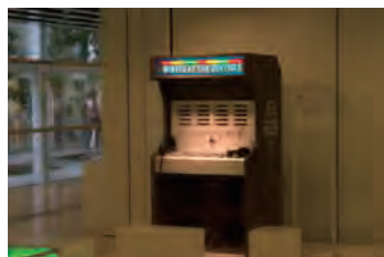
TIME WARP SOUND CLASH SYSTEM

動物時間 等身大のゾウやウマのパレオンをさわって、それぞれの鼓動や命の時間を感じてみましょう。大きさの異なる動物だと、鼓動の大きさや速さはどのように違うのでしょうか？